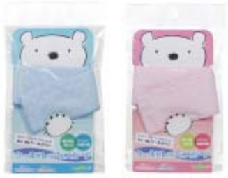
クールフレッシュスカーフ ライトブルー クールフレッシュスカーフ ライトピンク