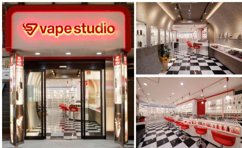
赤と白を基調とした明るい店舗