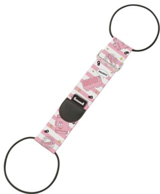
【バーバパパ バッグとめるベルト】